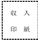
※印紙税額は裏面参照